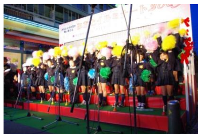
かわいらしい園児たちの合唱