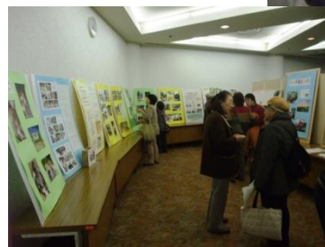
ハイチの会による ハイチ自立支援活動のパネル展示

※当日は、ハイチの会による緊急支援募金の受付をいたしました。ご協力いただいた皆さま、誠にありがとうございました。