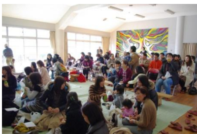
休憩タイムは親子で和気あいあい

港まちづくり協議会では、今後も今回のような聞く人を励まし、勇気づけるような講演会を地域の中で意欲的に続けてまいります。