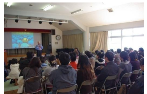
夫婦での参加も目立った会場