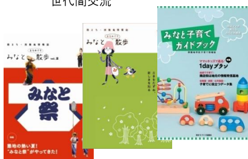
テーマ別の みなと情報を発信