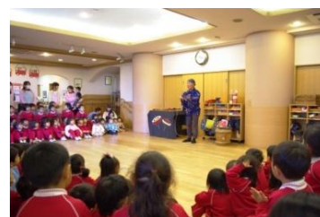
大人も子どもも真剣に遊んだ 伝承遊び