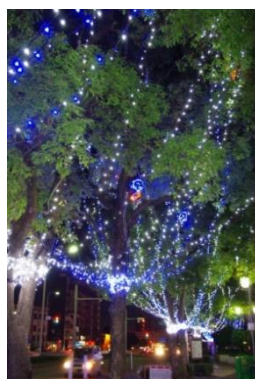
好評を博した 樹木イルミネーション