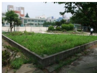
西築地小学校の学校園となるスペース