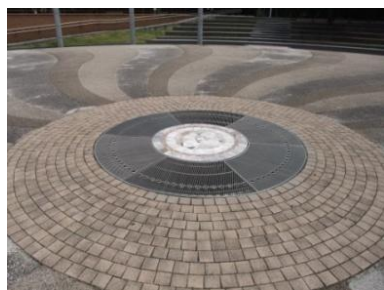
港橋広場公園の噴水