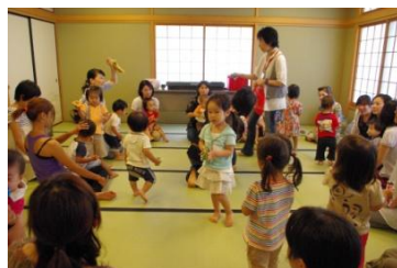
お母さんと子どもを中心とした 世代間交流