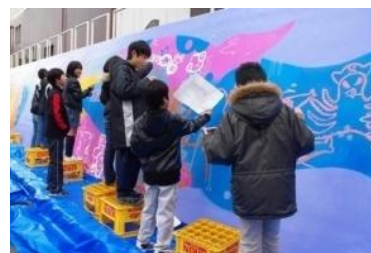
未来の芸術家が描いた壁画