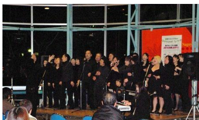
練習の成果を発表！ 築地VOICE OF WAVE のみなさん

また、港区や名古屋市中で活動されている他のゴスペルグループの方々の発表もあり、元気な曲からしっとりとした曲等、色々なタイプのゴスペルを楽しめる会となりました。