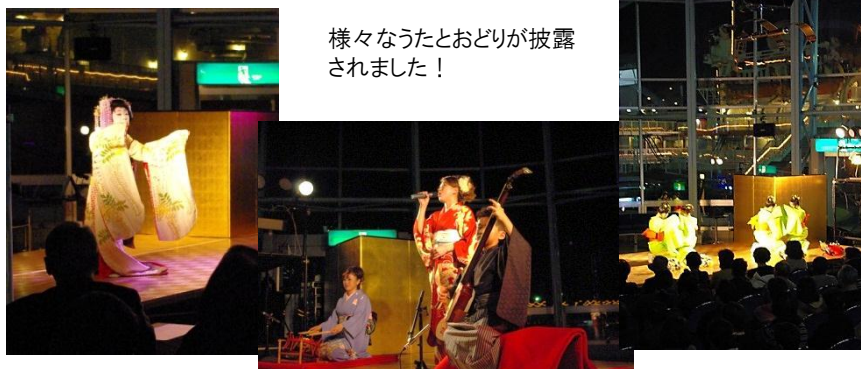
様々なうたとおどりが披露されました！