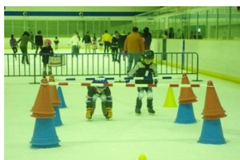
道具を使った本格的な練習です