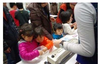
大人気のペンギンの羽毛カード作り！