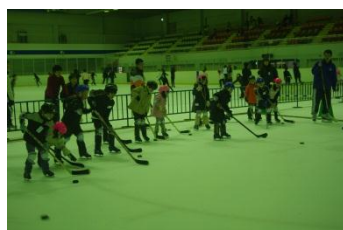
最終回はアイスホッケー体験！