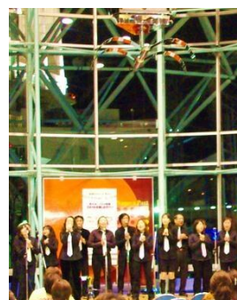
港区で活動されている 港ゴスペルクワイヤーのみなさん