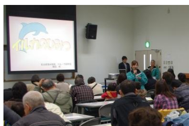
イルカやクジラのお話をうかがいました