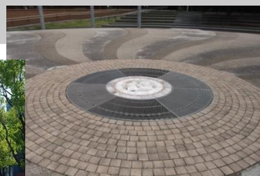
港橋広場公園の噴水