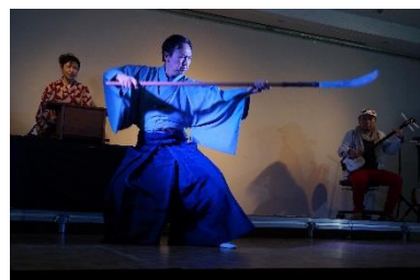
第5回は三味線とお囃子とのコラボレーション