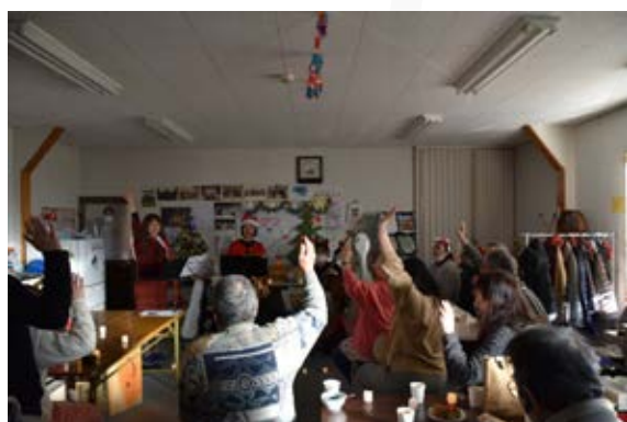
NPO すずめくらぶ、かもめくらぶ