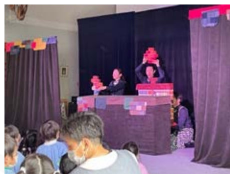
小鳩幼稚園での防災人形劇の様子