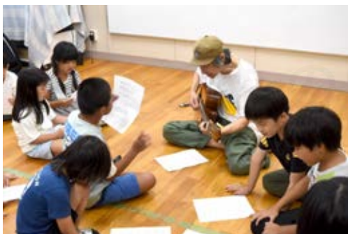
トワイライトスクールへの講師派遣