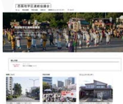
学区連絡協議会 HP 制作