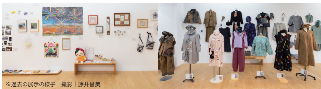
※過去の展示の様子

「つくるを集めてまちをひらく」は、今年で5年目を迎えます。これまで街に暮らす人や働く人、ゆかりのある人々の作品を集め、港まちに息づく“つくる”の姿を紹介してきました。市井の人々が、誰に頼まれたわけでもなく日々せっせとつくり続けている品々には、どこか魅力を感じてしまいます。作品を展示いただくみなさんに、可能な限り、「なぜ、どうしてそれをつくるのか？」を伺いながら、出展者みなさんの工夫やこだわり、そこにある光や彩りを言葉にしてみたいと考えています。