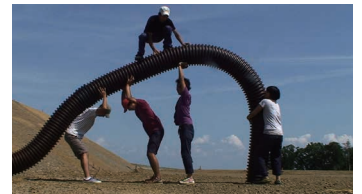
《Documentation of Hysteresis》* 参考作品