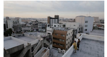
《右にミナト、左にヘイワ。》2017

1977年愛知県生まれ、同地在住。専門は映画史・映像理論・映像制作。研究テーマに地域コミュニティとの関わりを軸とした映像制作・上映活動など。2016年に港まちづくり協議会「平成28年度提案公募型事業」で西築地学区を舞台にした映画『右にミナト、左にヘイワ。』を制作（監督・脚本を担当）。2012年より愛知芸術文化センター・愛知県美術館オリジナル映像作品作家選定委員を務める。共著に『身体化するメディア/メディア化する身体』（風塵社、2018年）。