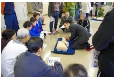
レクチャーを受ける皆さんは真剣そのもの

港まちづくり協議会では、今後もAEDの講習会を行っていく予定です。実際にAEDを使った訓練に参加いただくことで、誰もが自信を持って救命にあたるよう、引き続き応援してまいります。