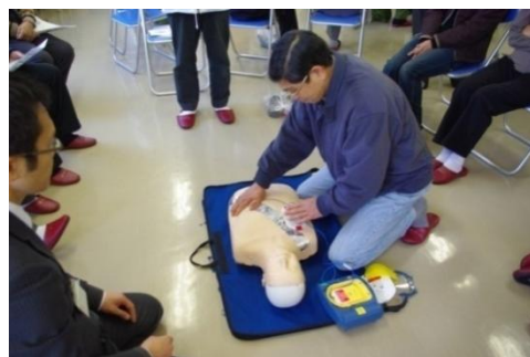
実際にAEDに触れることが自信につながる