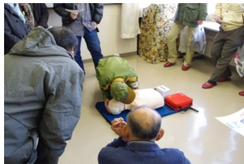
まずは呼吸の有無を確認