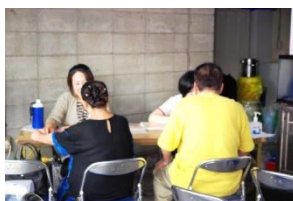
中部労災病院さんによる健康相談は、大人に人気