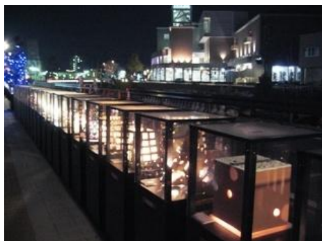
陶器・磁器・ガラスのあかりアート作品が まちに飾られる