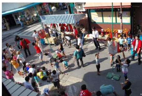
盛り上がった玉入れ大会