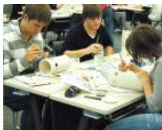
作家の講師に教わる体験教室