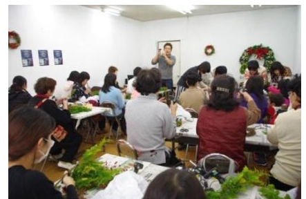
昨年度のクリスマスリース教室