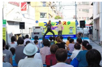
マジックや歌謡ショーなどのステージ