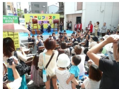
元気いっぱい幼稚園児の太鼓