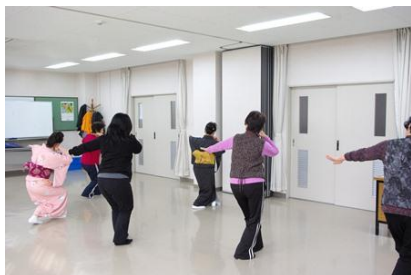
美しい音楽に合わせて、体を動かします。

熱心に先生に質問されている様子を拝見して、この地域の皆さんの踊りに対する関心の高さを改めて感じました。