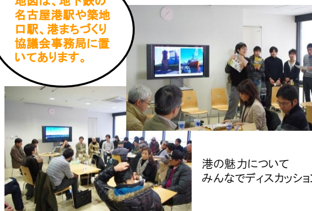
港の魅力について みんなでディスカッション

地図は、地下鉄の 名古屋港駅や築地 口駅、港まちづくり 協議会事務局に置 いてあります。