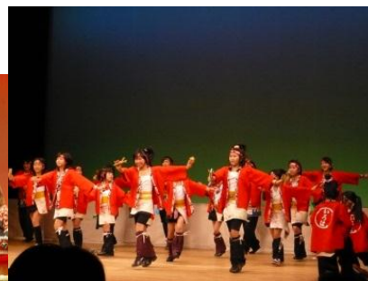
地域で活動するみなさんも太鼓や踊りを披露しました