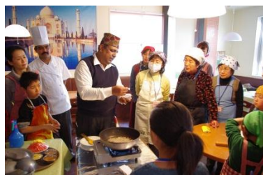
本格的なインドカレーを教わりました