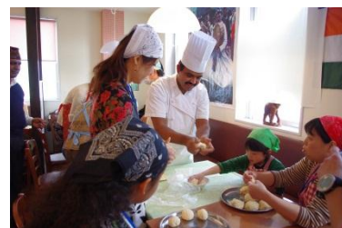
コックさんの鮮やかな手つきに感動！