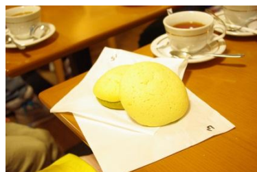
ビスケット生地のかかったあんぱんです

来年度も、みなとにあるお店と地域の皆さんを繋ぐ料理教室を企画していきますので、どうぞお楽しみに！