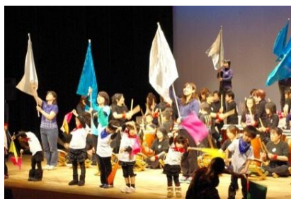
太鼓、踊り、カラーガードの成果発表