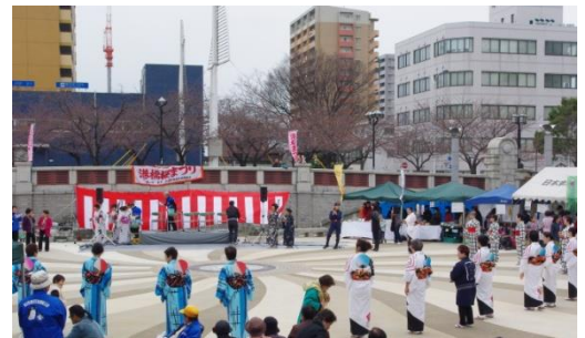
会場となる港橋広場公園には、子どもから大人まで、多くの人々が訪れます。みんなこの日を楽しみにしているんですね。

暖かな春の日差しの下で、桜を眺めながらの一日交流。皆さんもぜひお出かけください。今年も、どうか晴れますように！