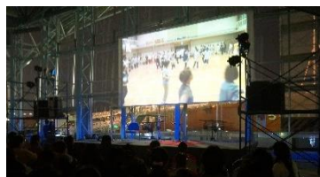
このまちシネマさんの『みなとまちLIFEみなと祭2013』