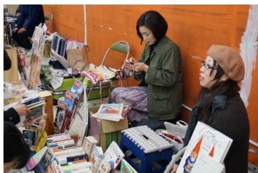
あらゆる分野の本が並んだ古本市