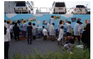
昨年度の壁画制作の様子

これまでに授業時間内に2回のワークショップを行い、みなと祭の歴史や、子どもたちの思い出に残る祭りの様子などをモチーフにしました。完成したモチーフをもとに、11月16日（水）には実際に旧防潮壁に壁が描きます。どんな壁画ができるのかお楽しみに！