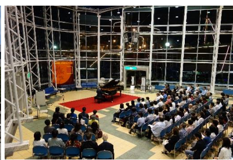
ポートハウスを会場に一流の演奏家によるピアノリサイタル