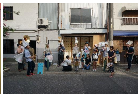
作曲と演奏の体験ワークショップ【トラベルムジカ】