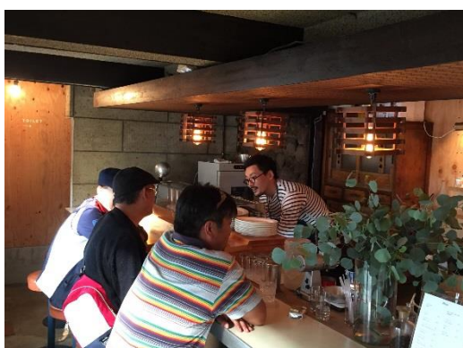
旧潮寿司を改修したカフェ《UCO》 【L PACK.】