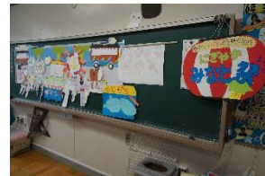
子どもたちの作ったモチーフ