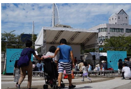
0歳から楽しめるピクニックのようなコンサート