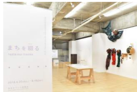
「まちを綴る | taste our tracks」(2018)の展示風景▶