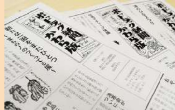
ポットラック新聞かわら版