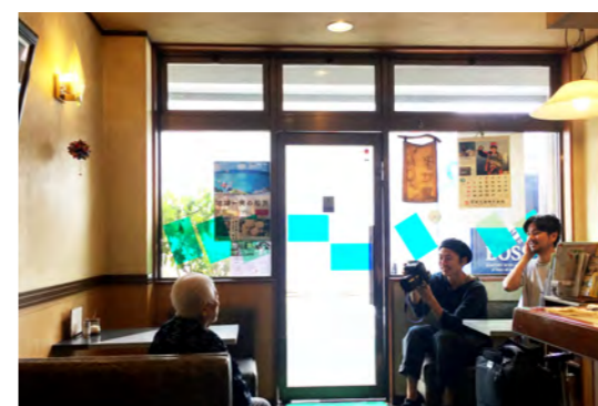
▲インタビューの様子