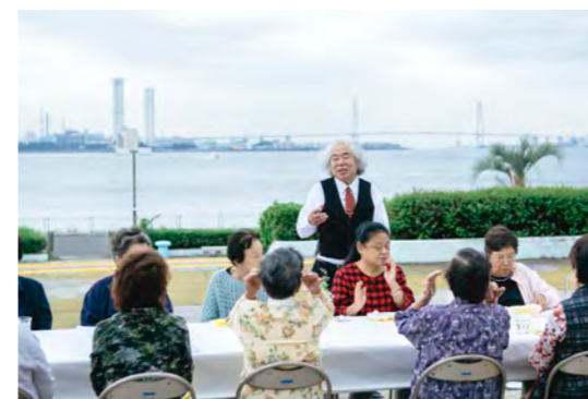
▲「おばあさんのランチ in 港まち」の様子