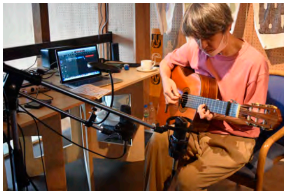
現在のスタジオ：楽曲作りの様子▲