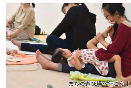
まちの遊び場へ行こう！