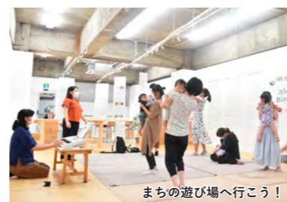
まちの遊び場へ行こう！