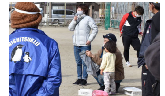
▲ 携帯トイレの使い方説明