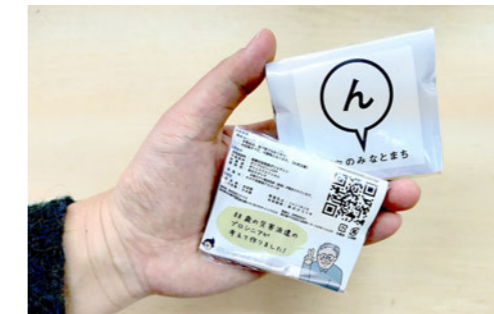
▲ 3回分使える携帯トイレ