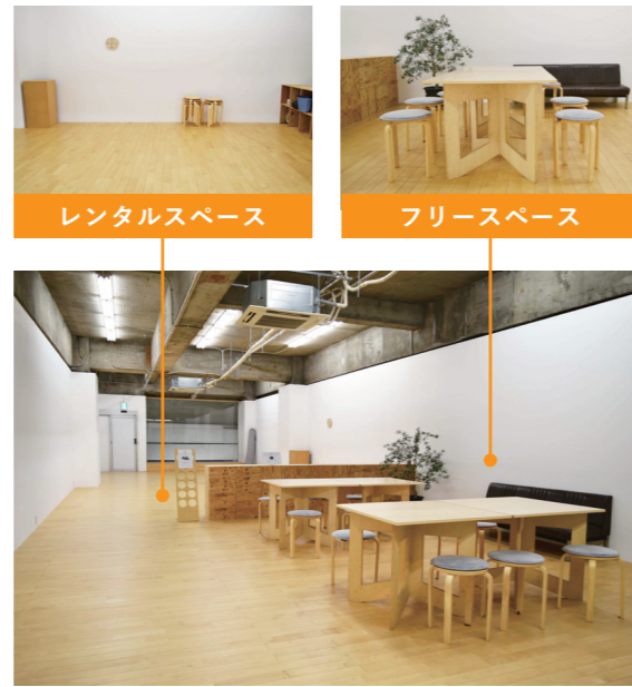
レンタルスペース

2021年5月から始まった港まちポットラックビル2階奥の事前予約制のレンタルスペース。まちの方からまちの外の方まで、踊りの練習や会議、ストレッチなど、さまざまな用途でご活用頂いております。2階手前はフリースペースとして、机やソファ、フリーWi-Fiもご用意しておりますので、ちょっとした休憩や勉強など、どなたでもお気軽にご利用ください。